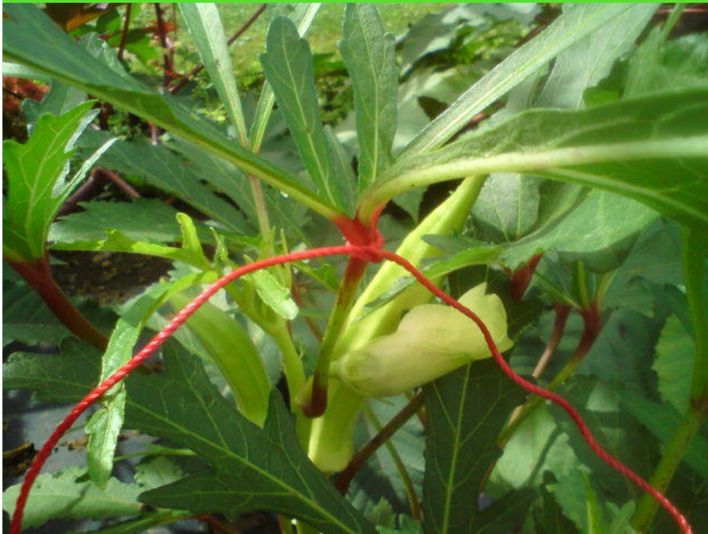
Okra, matična rastlina, označena z rdečo vrvico

Semena pridelujemo sami. Nekaj semen so prinesli dijaki od doma in nekaj šolskih semen so dijaki odnesli domov. Semena smo prejšnjo sezono pobirali le od najboljših matičnih rastlin.